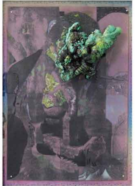
Mixed Media 40x60

알렉산드로 로마 작품들 안에는 다양한 디자인과 형상과 색과 소재와 방식이 자유롭게 배치되어 존재하지만 그것들이 한데 어우러져 만들어 내는 전체 이미지는 그의 머릿속에서 재해석된 상상 속 자연 풍경 그 자체이다. 작가는 그러한 작품을 만들어 내는 과정을 통해 힘들여 살아내는 매일 매일의 일상으로부터 해방되어 마음의 위로와 치유를 받고 또 완성된 자신만의 꿈의 정원에서 심리적 평안과 자유를 만끽하고 있는 것은 아닐까. 그의 작품을 접하는 우리들도 역시 우리 각자의 느낌대로 알렉산드로 로마가 만들어 낸 한 폭의 환상 정원에서 잠시 거닐어 보자.