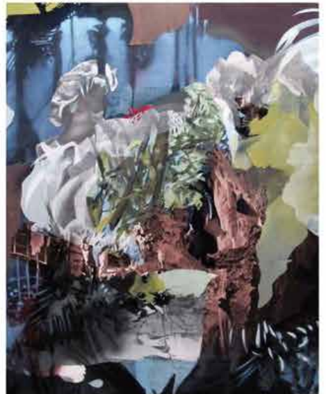
Mixed Media 110x140