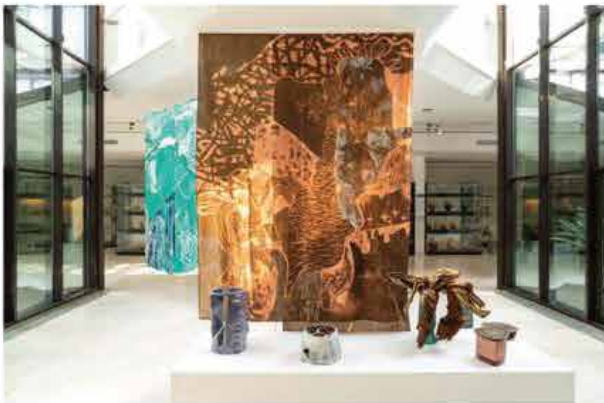
Mic, International ceramic museum in Faenza Italy